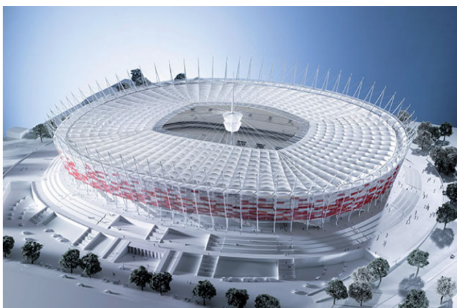
Bild 4. Modell des Nationalstadions in Warschau