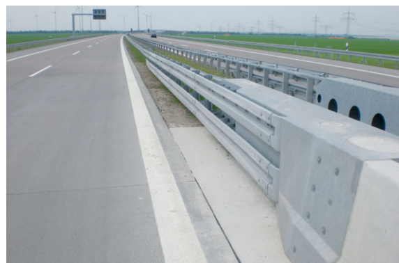
Die Übergangskonstruktion EURO-RACCORD ® EDSP verbindet Einfache Distanzschutzplanken (EDSP) aus Stahl und monolithische Betonschutzwände

EUROVIA GmbH, Frank-Zappa-Straße 11, 12681 Berlin, Tel. (0 30) 5 46 84-0, Fax (0 30) 5 46 84-8 09, eurovia@eurovia.de, www.eurovia.de