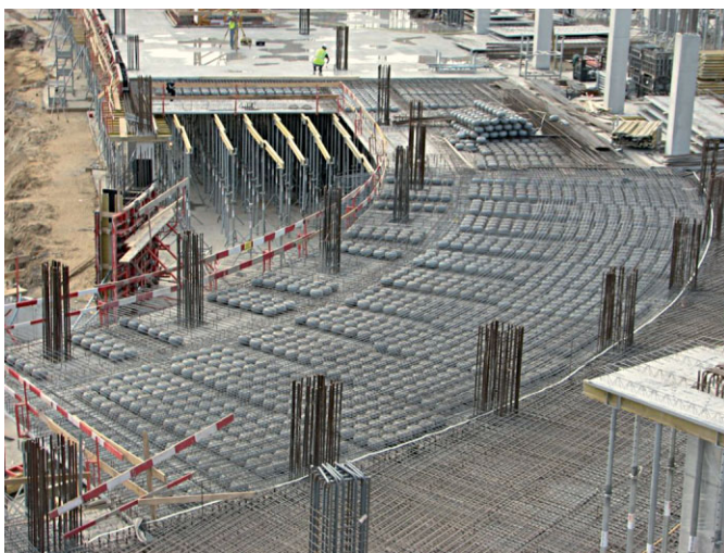
Bild 5. Im Nationalstadion in Warschau kommen 152000 m 2 cobix ® -Hohlkörperdecken zum Einsatz

durch die Berücksichtigung der cobix ® -Technologie in einer möglichst frühen Planungsphase können durch die Optimierung der gesamten Tragstruktur die Gesamtkosten eines Gebäudes erheblich reduziert werden. Ein weiterer wesentlicher Aspekt sind die zunehmend an Bedeutung gewinnenden Nachhaltigkeitszertifikate für Immobilien. So kann eine Immobilie, die z. B. nach DGNB, LEED oder BREEAM zertifiziert werden soll, durch die ökologischen Vorteile der cobix ® -Technologie eine bessere Bewertung erhalten und dadurch an Wert gewinnen.